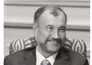
MURAT ÜLKER YILDIZ HOLDİNG Yönetim Kurulu Başkanı