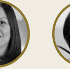
T lin Mede Esmer Mercedes Benz T rk Controlling Kamyon Direkt ri