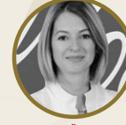
Ebru  zgen Geni C li İnceleme Grup İnsan Kaynakları Direkt ri