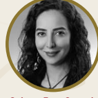
G křen T re Sancak Ford Otosan Genel M d r Yardımcısı, Malzeme Planlama/Lojistik