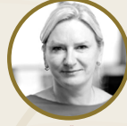
Kasia  zgen Anadolu Efes Pazarlama Direkt ri